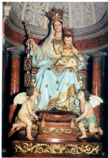
Regina Decor Carmeli Haifa - Israel